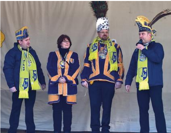
Gemeinsam feiern mit Detten beim Münsterland Biwak