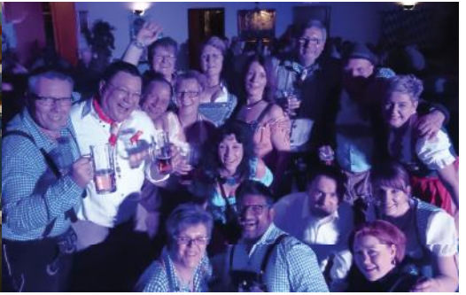
Gemeinsam feiern beim Oktoberfest der ReKaGe