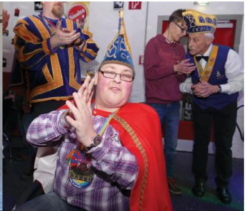
Gemeinsam feiern bei der "Integrativen Disco"