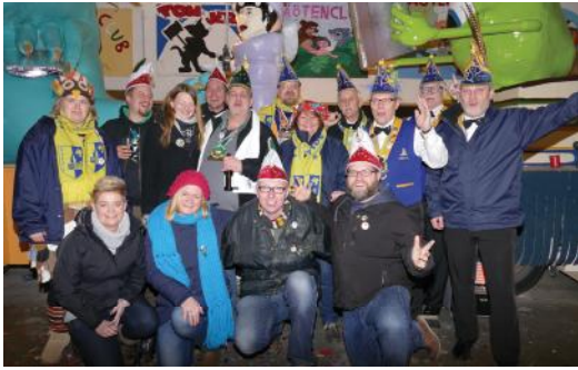
Gemeinsam feiern mit dem TöötentClub