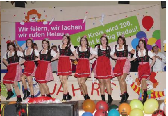
Gemeinsam feiern mit den Springmäusen beim Empfang des Landrates