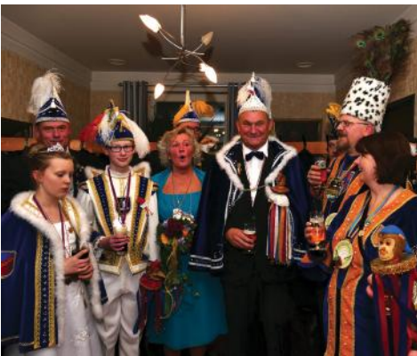
Gemeinsam feiern mit unseren Freunden vom KaKIV